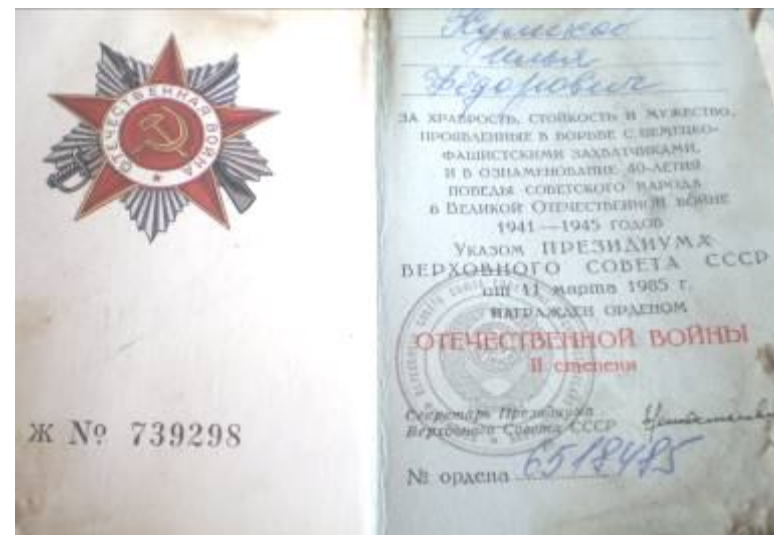
Орден «Великой Отечественной войны II степени»