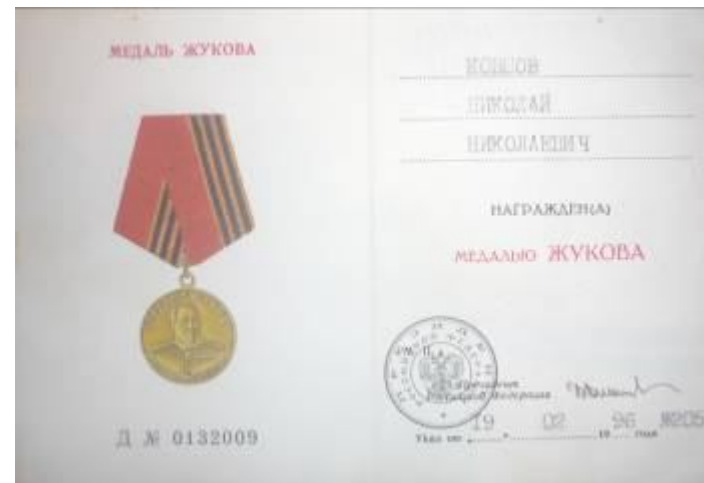
Медаль Жукова (1996 г.)