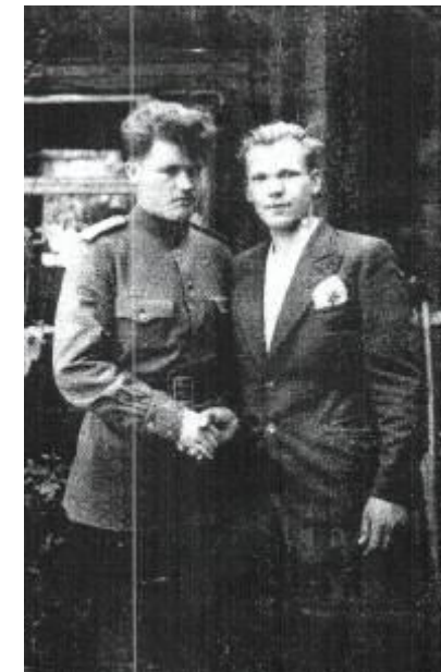
Встреча с братом в госпитале