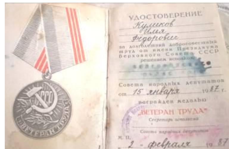
Медаль «Ветеран труда» (1987 г.)