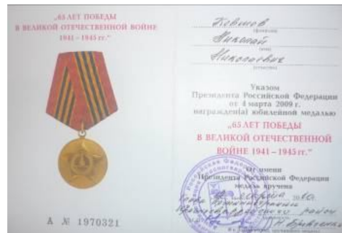
Юбилейная медаль к 65-летию Победы (2010 г.)