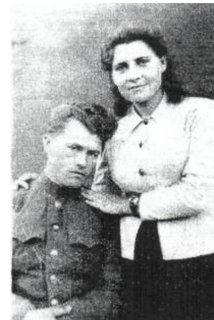
Фото с женой