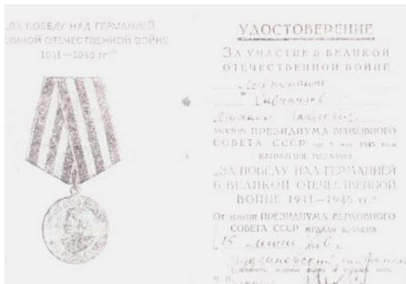
Медаль «За победу над Германией»

получил благодарность от Верховного Главнокомандующего Иосифа Сталина.