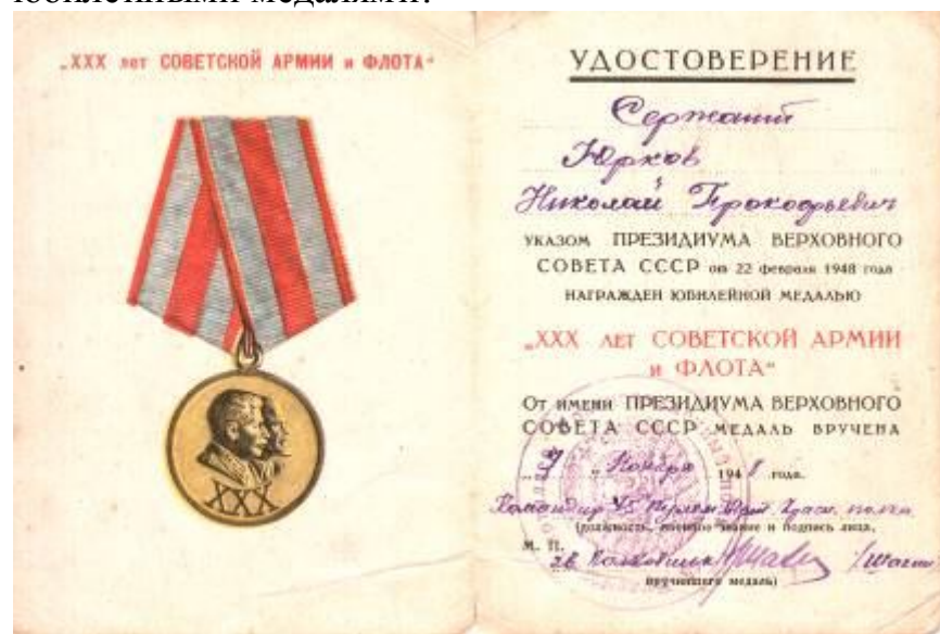
«XXX лет Советской Армии и Флота» (1948 год),