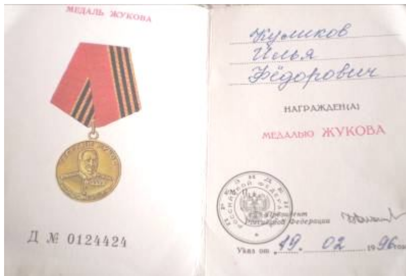
Медаль Жукова (1996 г.)

Разгромили фашистские войска под Сталинградом. После выздоровления домой не смог вернуться, нужно было восстанавливать разрушенный город.