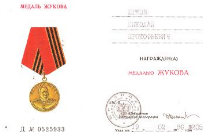
медалью Жукова (1996 год),