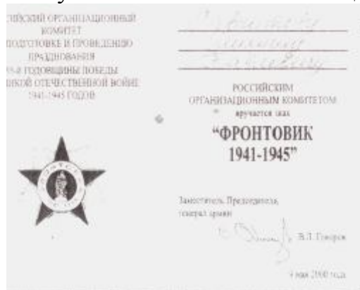
Знак «Фронтовик 1941-1945» (2000 г.)

В 1946 году поступил в Новооскольское педагогическое