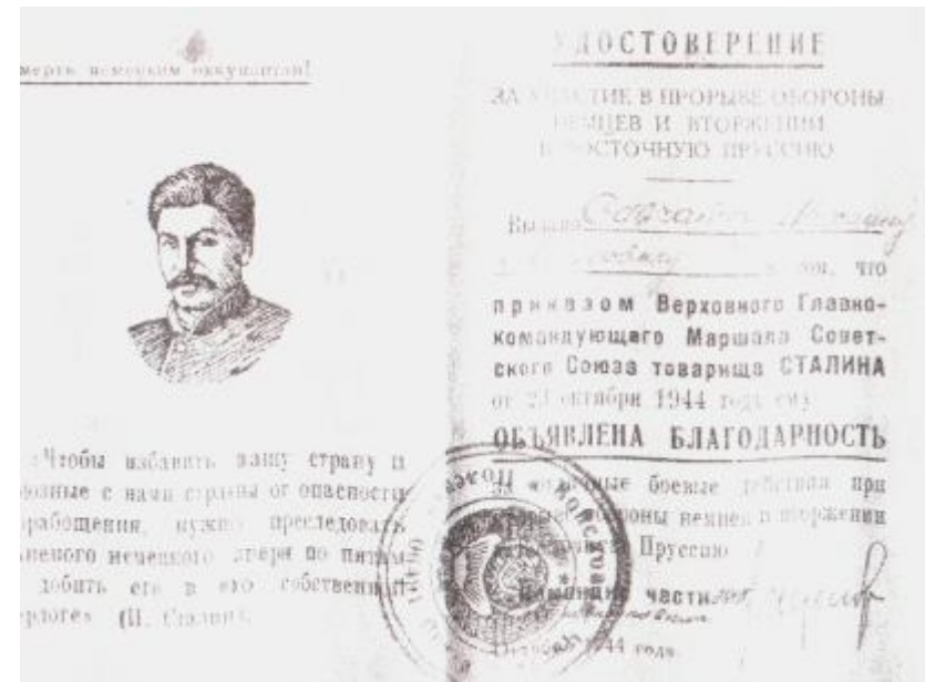
23 октября 1944 г. – благодарность