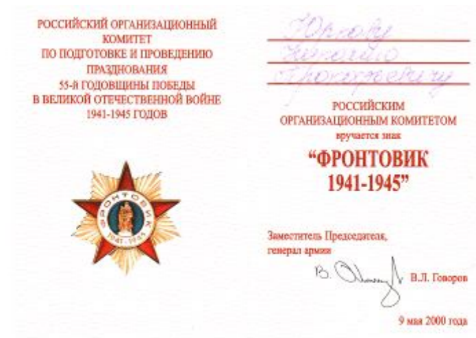
знаком «Фронтовик 1941 – 1945» (2000 год),