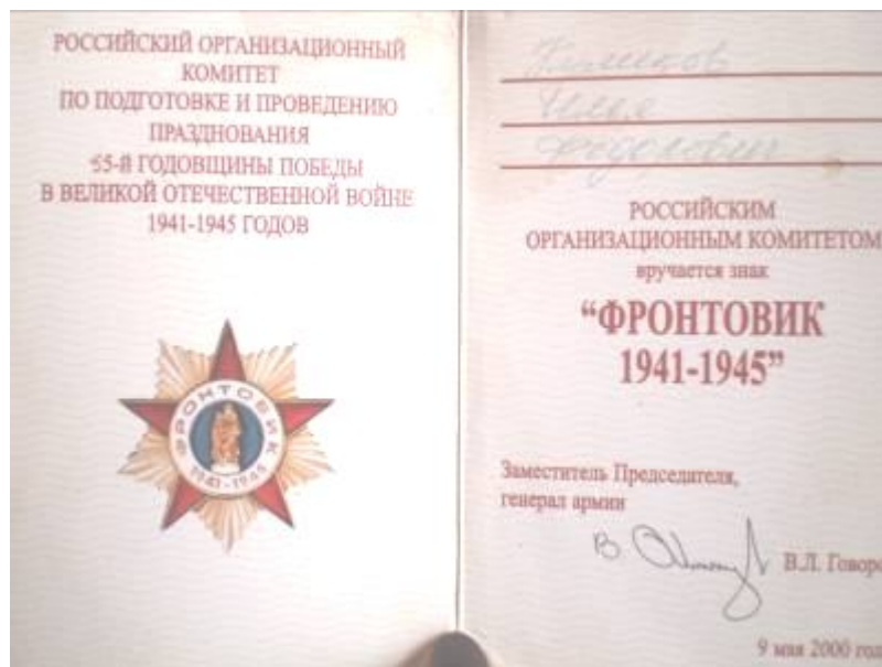
Знак «Фронтовик 1941 - 1945» (2000 г.)