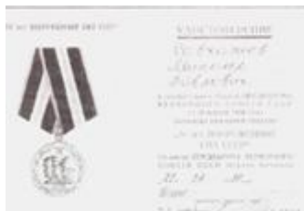
Медаль «70 лет Вооружённых сил СССР» (1988)