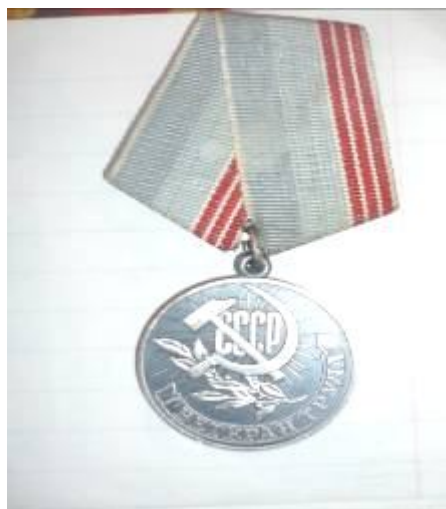
Медаль ветерана труда