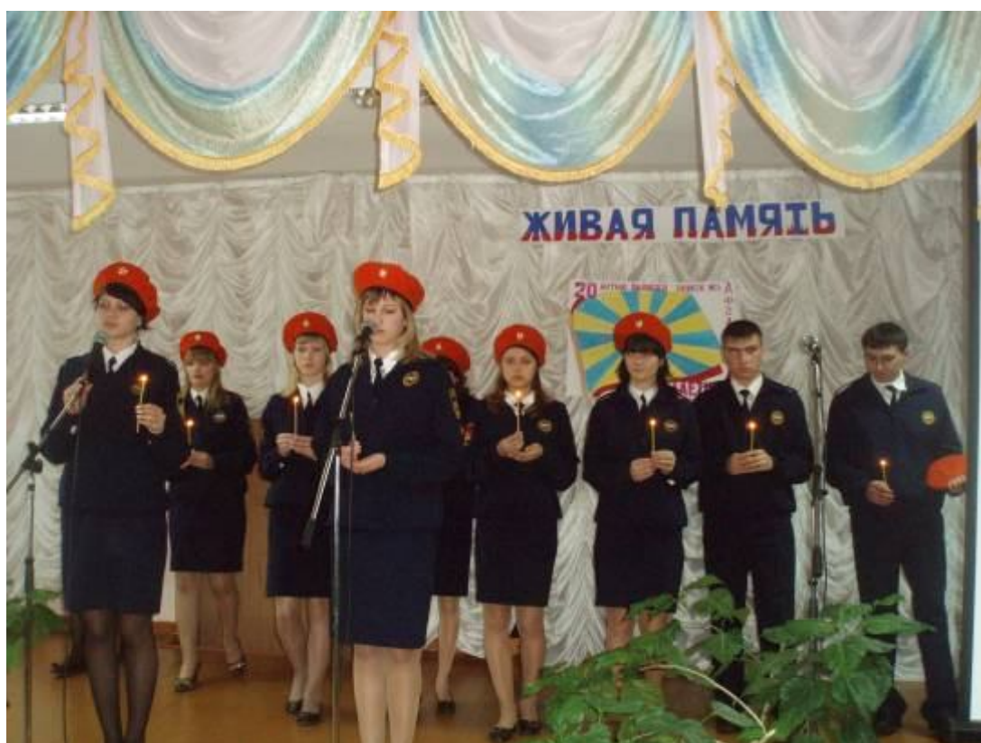
15 февраля 2009 г. – общешкольное мероприятие «Живая память», посвящённое 20-летию вывода советских войск из Афганистана