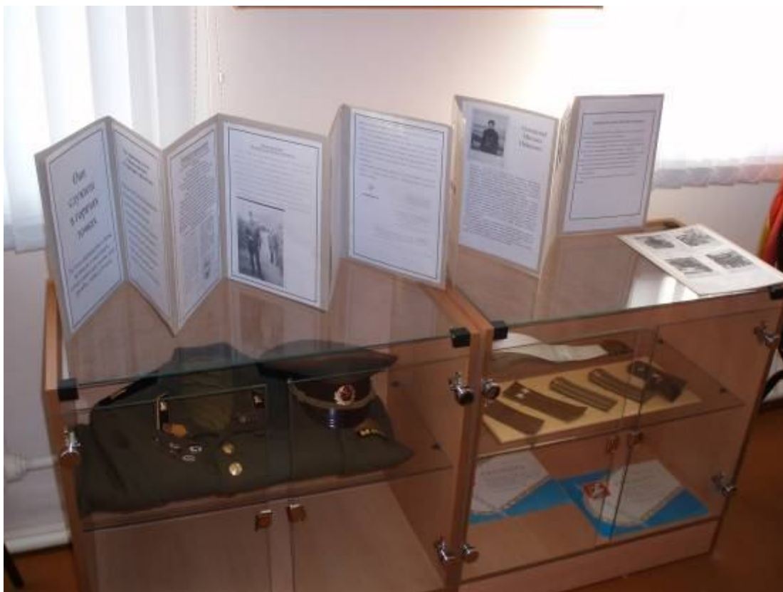
Экспозиция «Они служили в горячих точках»