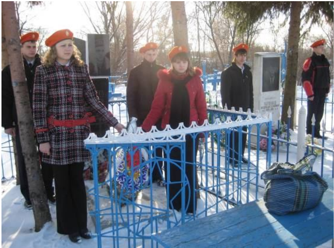
Вахта памяти у могил погибших воинов – интернационалистов