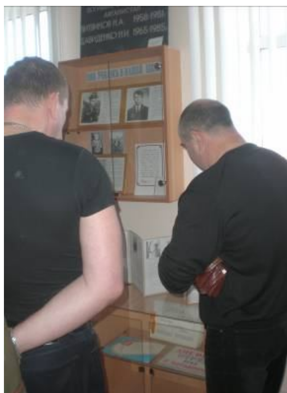
Экскурсия для однополчан в школьном музее