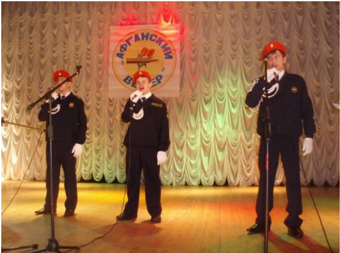
Участие членов кружка «Музейное дело» в районном смотре-конкурсе патриотической песни «Афганский ветер»