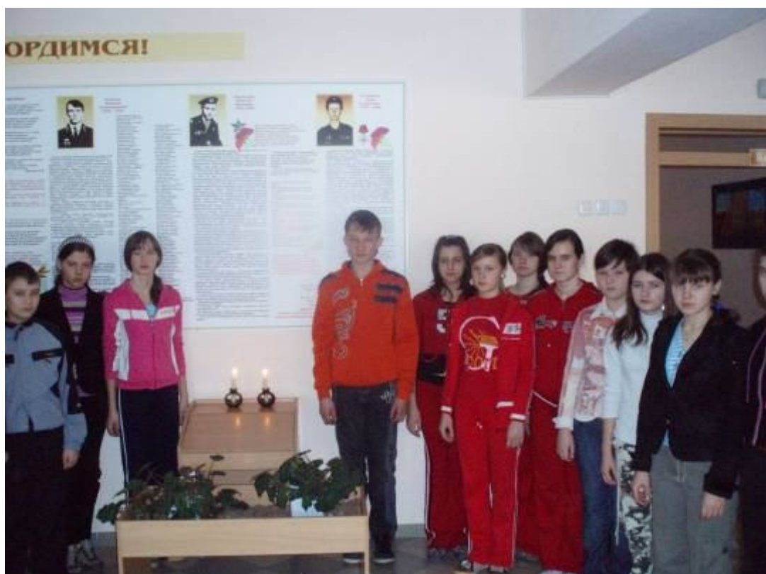
15 февраля – День памяти. Радиолинейка, посвящённая выводу советских войск из Афганистана