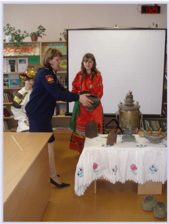
Музейный урок «Так бывало в старину»