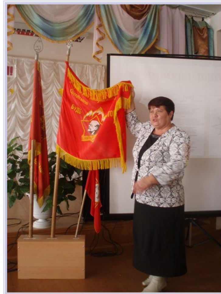
Музейный урок «История пионерского движения»