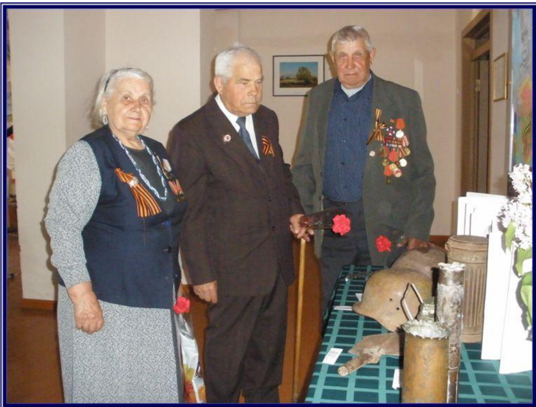
Члены Совета ветеранов на выставке экспонатов школьного музея времён Великой Отечественной войны, посвящённой освобождению с. Засосна от немецко-фашистских захватчиков