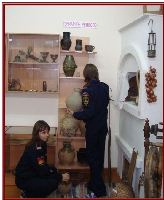
Оформление выставки «Гончарное ремесло»