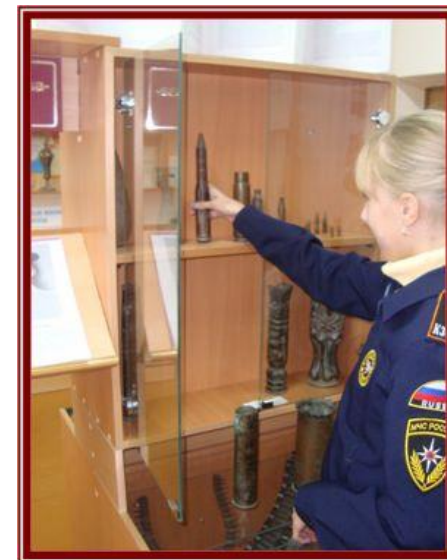
Пополнение экспозиции «История ВОВ» новыми экспонатами»