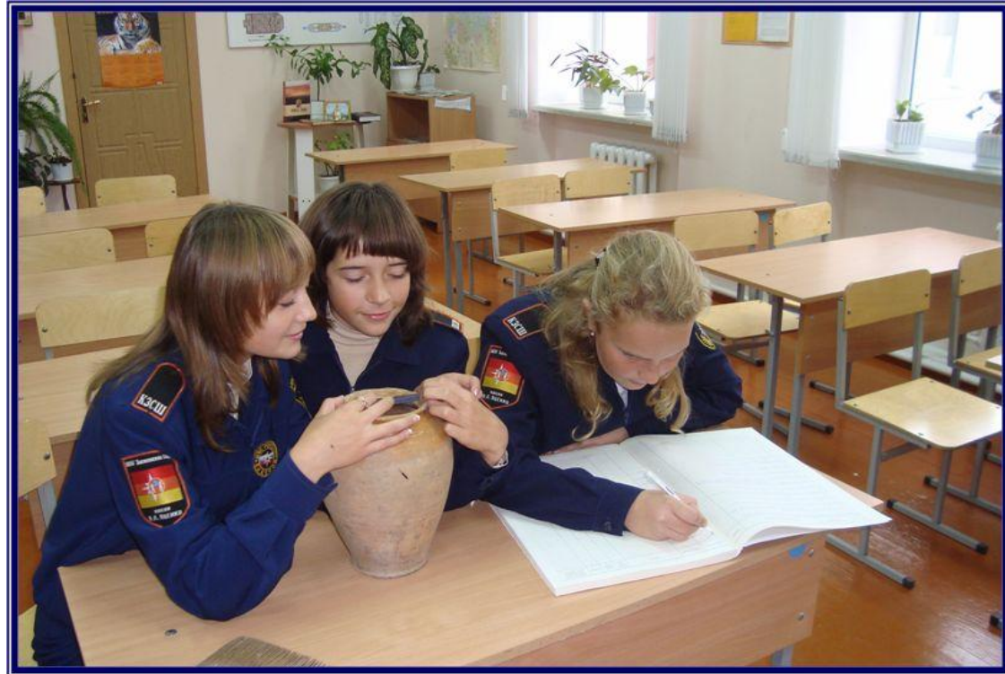
Описание музейных предметов