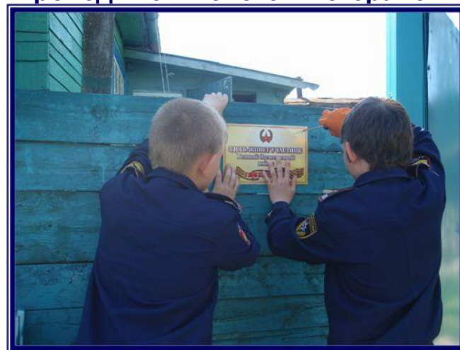
Участие в акции «Никто не забыт...», проводимой Советом ветеранов