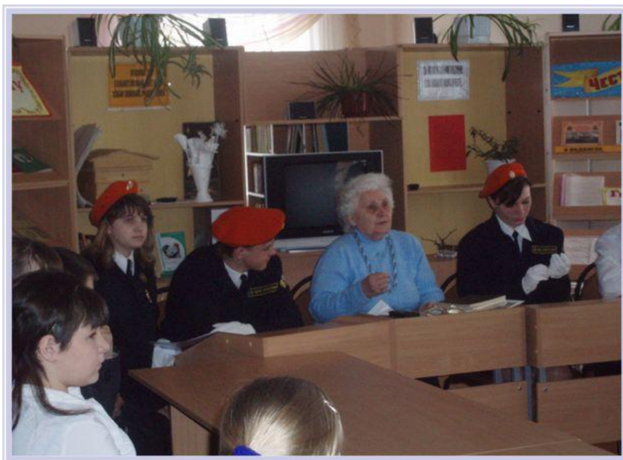
Круглый стол «У героев имён не счесть»