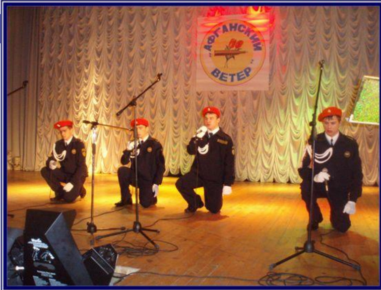
Участие в районном фестивале «Афганский ветеран» (Отдел по делам молодёжи)