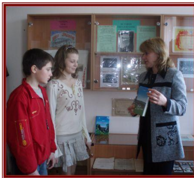
Знакомство с экспонатами для оформления раздела экспозиции «Труд засенцев – гордость и слава Белгородчины»