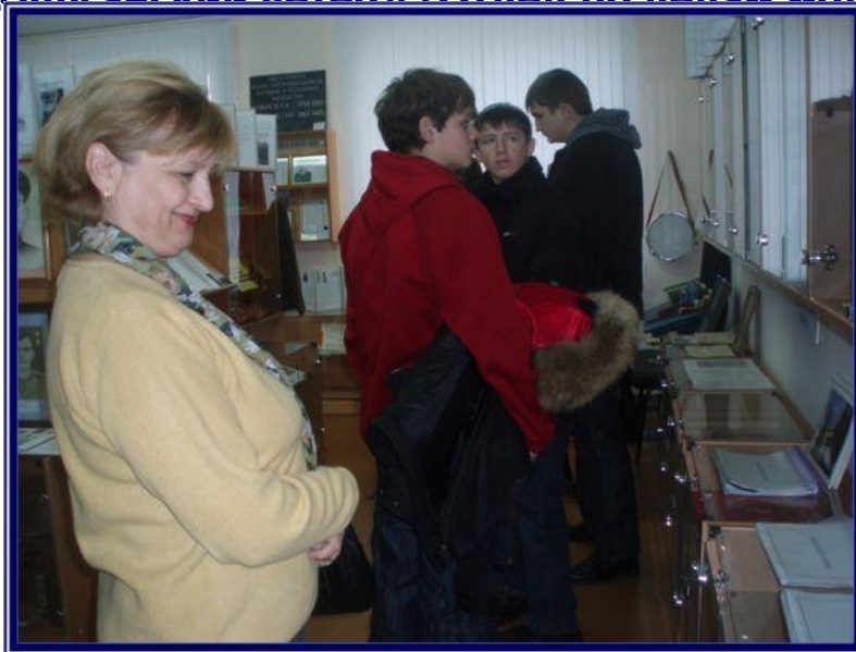
Экскурсия в музее для учащихся Коломыцевской СОШ