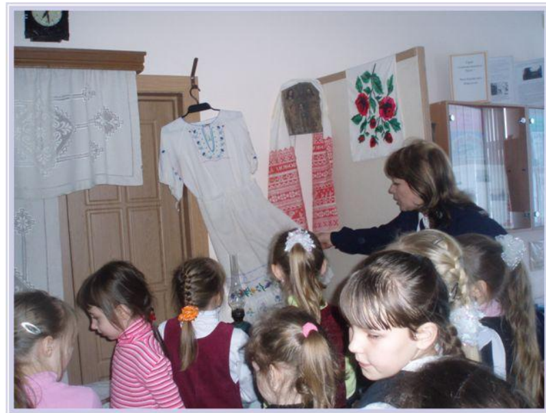
Экскурсия по разделу «Русская изба XIX - XX вв.»