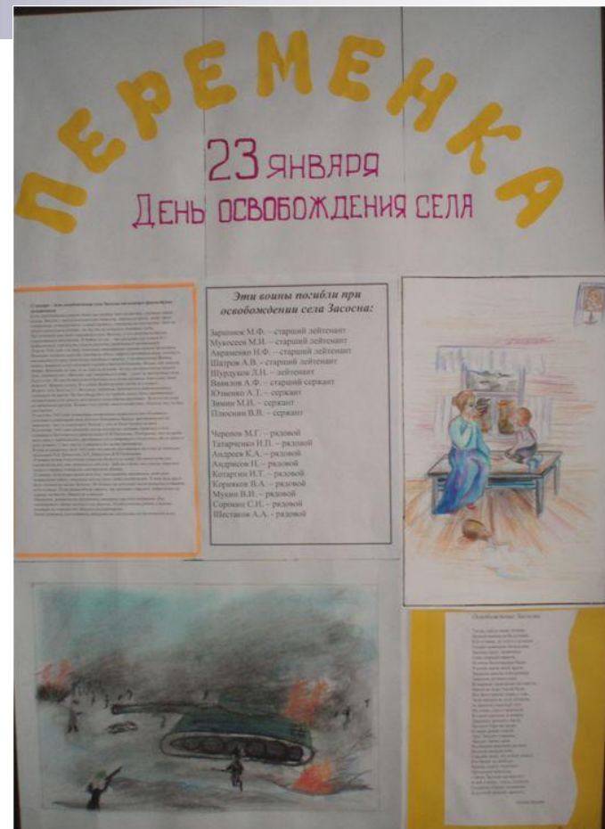
Выпуск школьной газеты «Переменка» к юбилейным и памятным датам