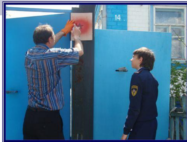
Участие в акции «Красная звезда», проводимой Советом ветеранов