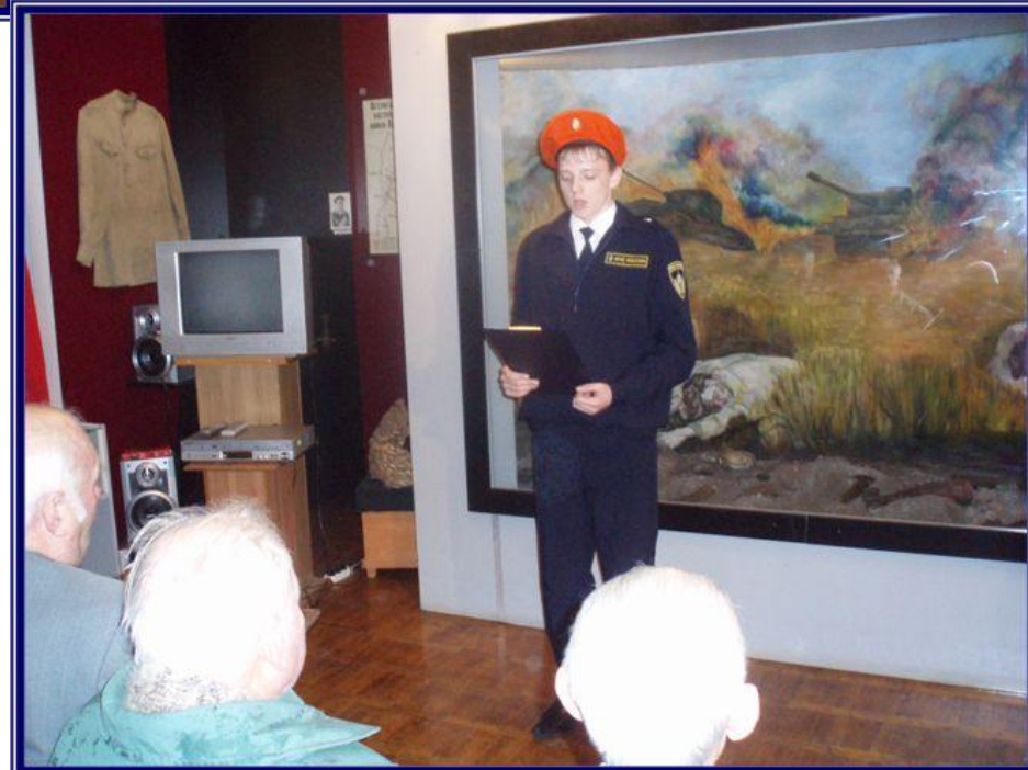
Выступление с докладом «Роль школьных музеев в патриотическом воспитании молодёжи» в Красногвардейском краеведческом музее на встрече с ветеранами Великой Отечественной войны