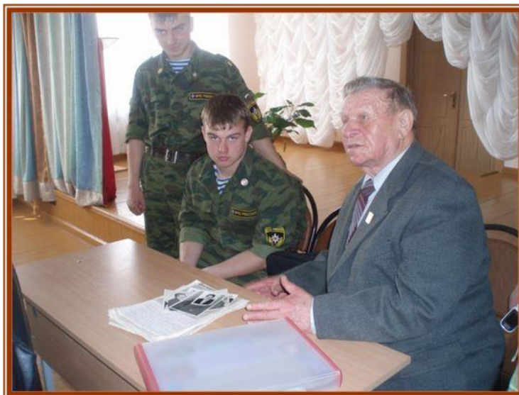
Сбор информации о передовиках колхоза