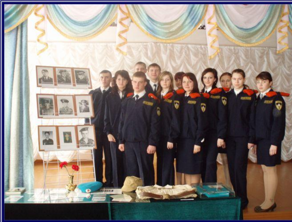
Выставка экспонатов Красногвардейского краеведческого музея на общешкольном мероприятии, посвящённом воинам-афганцам