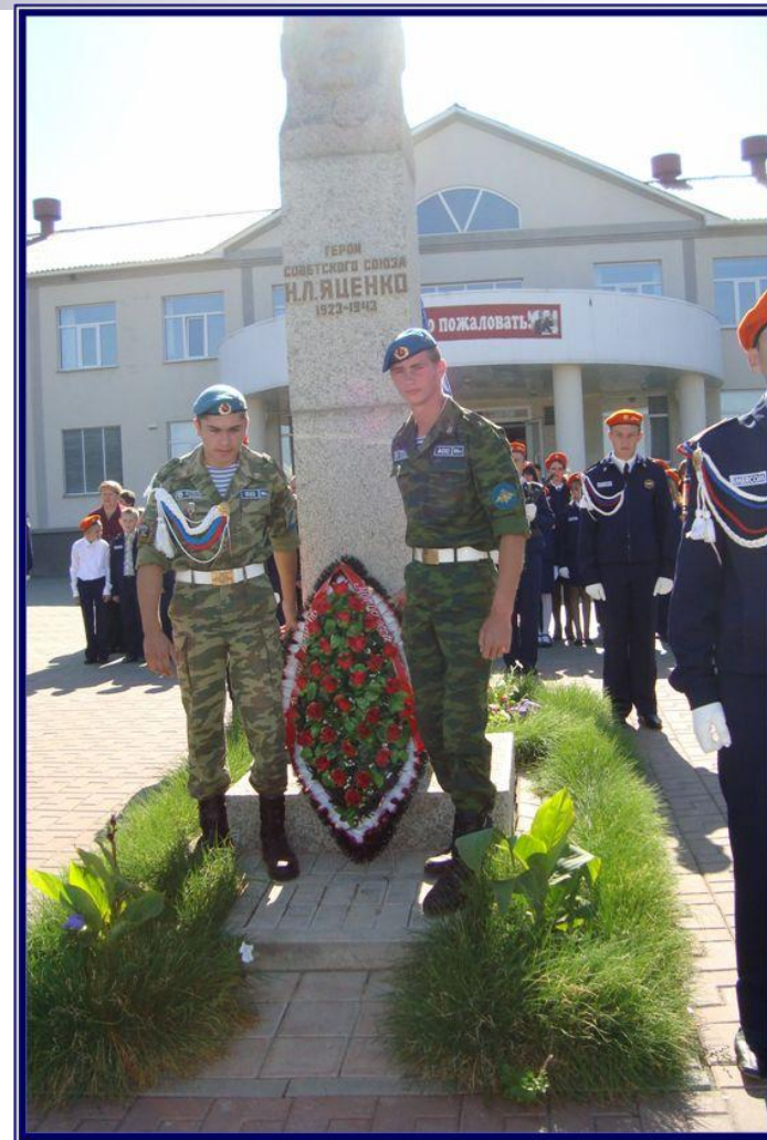
Открытие 49 межрайонных соревнований по мотокроссу имени Н.Л. Яценко (МО «ДОСААФ России»)